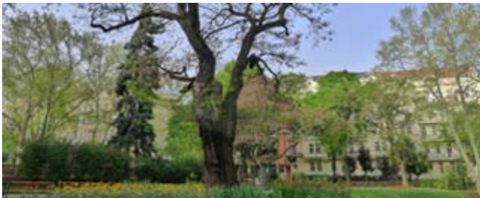
Iris Höll/Auszeit Yoga